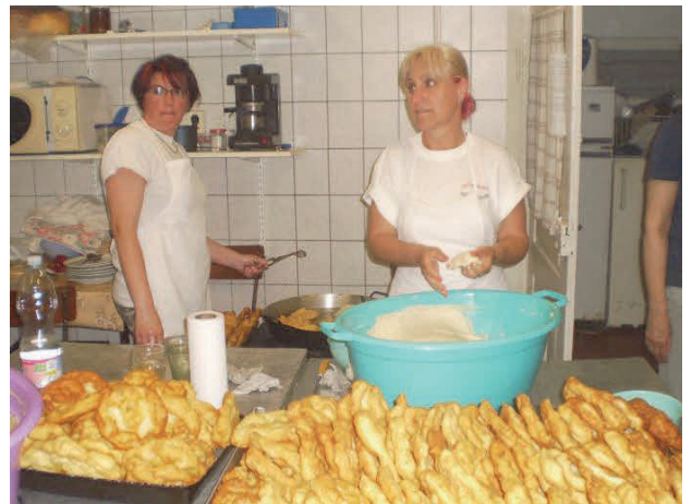
Készülnek a lángosok a gyereknapon

Az egyesület a 2015 – 2016. évi gazdálkodási adatai alapján megfelel a közhasznúsági feltételeknek, közhasznú jogállását megtarthatja 2017-ben is. A 2015 – 2016. év adózott eredménye a két év átlagában pozitív előjelű. Az szja 1 % és a közhasznú tevékenység ráfordításai megfelelnek a törvényben előírtaknak.